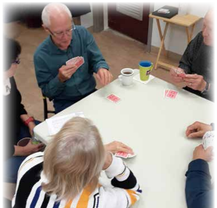
CAFÉ RENCONTRE Les rencontres se déroulent les mardis et jeudis.

PRIORITÉS 2022-2023. La bonification de l'offre de service sur tout le territoire. Le partenariat avec le service des Loisirs de la ville de Pointe-Calumet s'est concrétisé permettant d'offrir, à l'été 2022, des cours d'aquaforme et d'aquadétente à la piscine extérieure lequel se poursuivra à l'été 2023.