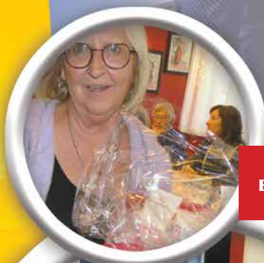
DÎNER DE NOËL DES BÉNÉVOLES AU FELLI 7 DÉCEMBRE 2022