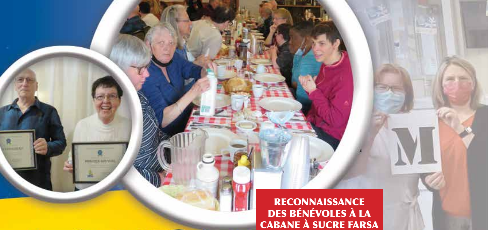
RECONNAISSANCE DES BÉNÉVOLES À LA CABANE À SUCRE FARSA 27 AVRIL 2022